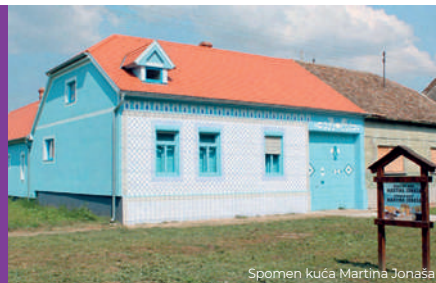
Spomen kuća Martina Jonaša