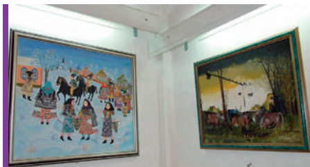
Galerija Naivnog slikarstva u Uzdinu