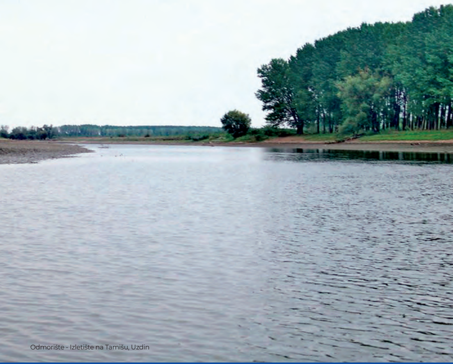
Odmorište - Izletište na Tarnišu, Uzdin