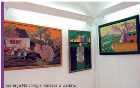
Galerija Naivnog slikarstva u Uzdinu