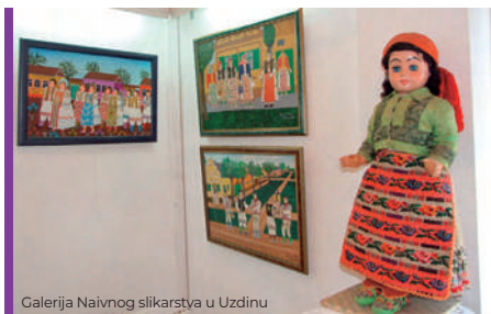
Galerija Naivnog slikarstva u Uzdinu