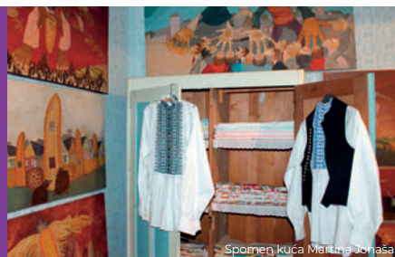
Spomen kuća Martina Jonaša